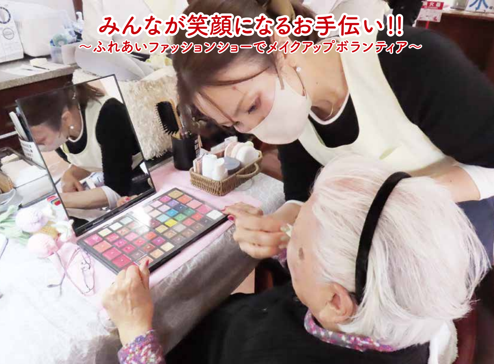
(ふれあいデイサービスセンター太宰府にて)

みんなが笑顔になるお手伝い!! ～ふれあいファッションショーでメイクアップボランティア～