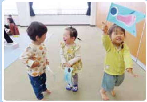
5月はこいのぼり製作! 成長の記録に足形をスタンプ!