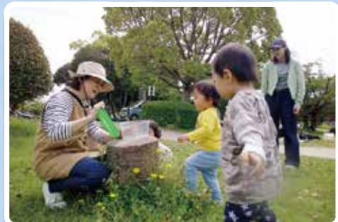
政庁跡や観世音寺などに行き、虫や花を観察したり、草スキーをしたりして遊びました!