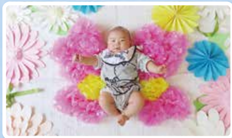
ねんねアートでみんな笑顔に☆ 春のテーマは「お花とちょうちょ」でした!