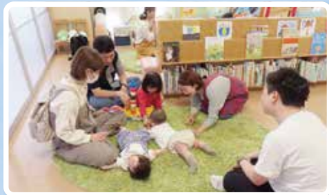
お父さんも気軽に参加できる土曜日の活動です! お散歩やピクニックをしたり、遊びを通してお父さん同士の交流も生まれます♪