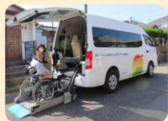
移送サービスボランティア