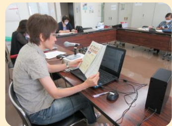
音声訳ボランティア