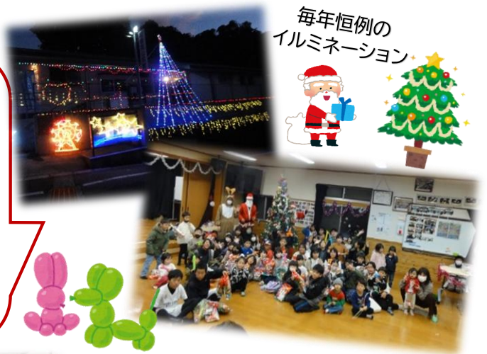
毎年恒例の イルミネーション

子供達は各々の想いを込めてツリーに飾り付けをして、射的、輪投げ等のゲーム、バルーンアートに興じます。そしてサンタさんから一人ひとりプレゼントを送られて歓声を上げます。又、ご来場の皆さんと一緒にカウントダウンでイルミネーション点灯を行って一層の盛り上がりを見せます。