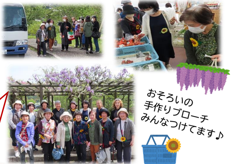
おそろいの 手作りブローチ みんなつけてます♪