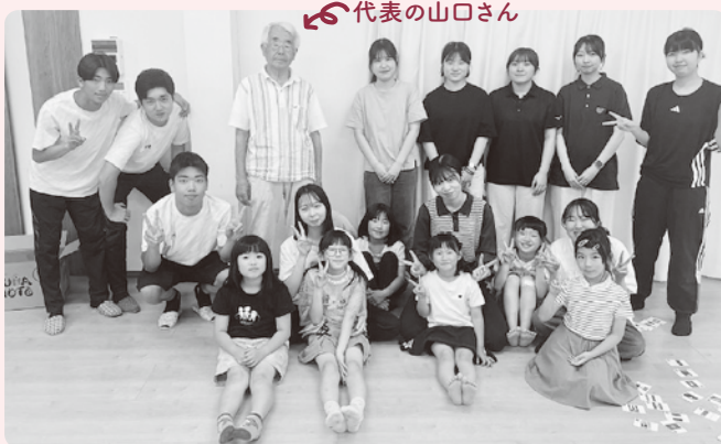
毎週金曜日 16:15～17:45 (小学生対象)