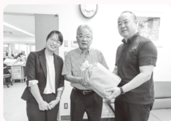
まごころサポート様より モルツクをいただきました！