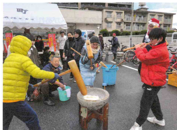
社会的課題への対応団体支援