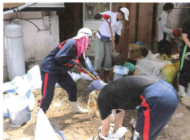
大規模災害時のボランティア活動支援