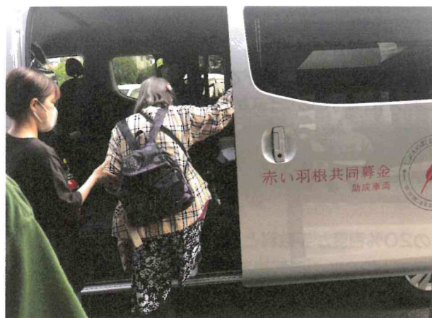
福祉施設の車両整備