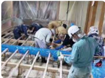
令和3年8月福岡県豪雨災害

共同募金配分金により購入した送迎用の車両で、利用者の病院受診送迎や外出支援に使用させていただきます。利用者様だけでなく職員にとっても、安全に安心して乗車することができます。心より感謝申し上げます。