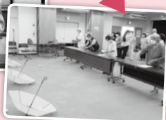
上手く狙えるかな~?