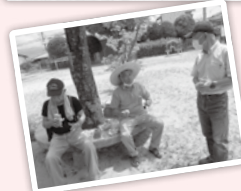
暑い日にはアイスを食べながら! 楽しいひと時です