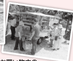
お買い物中のおしゃべりも楽しみの一つです