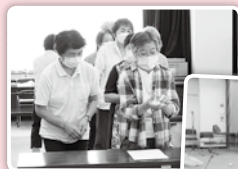
紙を丸めることで手の運動に♪