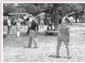
みんなで一緒にラジオ体操♪

企画をされている自治会役員さんの地域を想う取り組みが、地域の皆さんの元気づくりにつながっているようです。