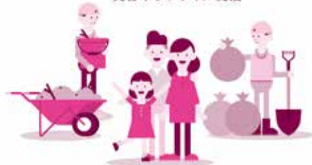
災害ボランティア支援