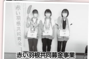
赤い羽根共同募金事業