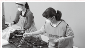
心のこもったあたたかい弁当を配付しました。