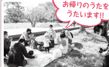
おとうさんといっしょ!