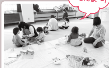
たんぽぽクラブ(ぞうグループ)