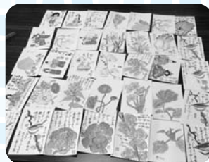
出来上がった作品の数々