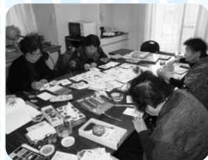
皆さん集中しつつも、時には手を止めておしゃべり