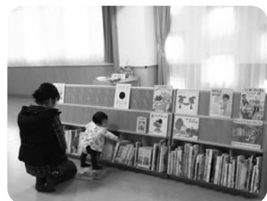
絵本のひろば「青空文庫」