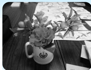
絵手紙の題材は自宅に咲いている花を持ち寄ったり、写真を参考にしています。