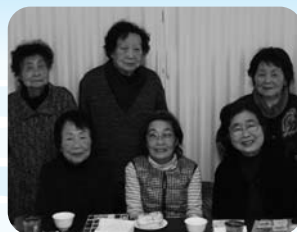
「絵手紙で交流」の皆さん