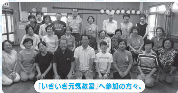
「いきいき元気教室」へ参加の方々。