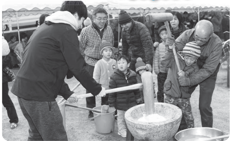
つつじヶ丘区 餅つき大会