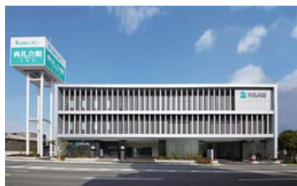
日本セレモニー太宰府典礼会館 太宰府市大佐野 1-4-10 ☎919-6123