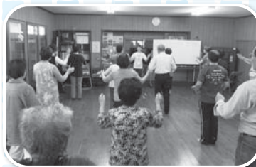
皆さん一緒に元気良く!!