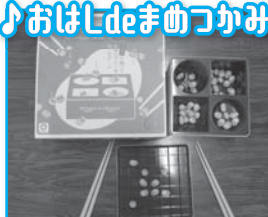
マナー豆 (在庫:2人用3セット)