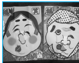
③福笑い (在庫:2枚入り5セット)