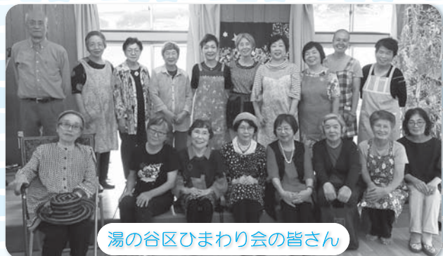
湯の谷区ひまわり会の皆さん

まだまだ未熟な私たちですが「ひまわり会に行ってみよう」と区民の皆さまに思っていたけように、会員一同、楽しく頑張ります。