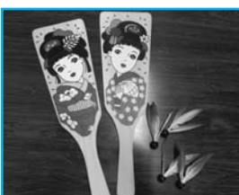
④羽子板セット (在庫:板1枚、羽2個入り9セット)