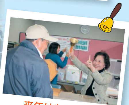
来年はあなたが 当たるかも!!