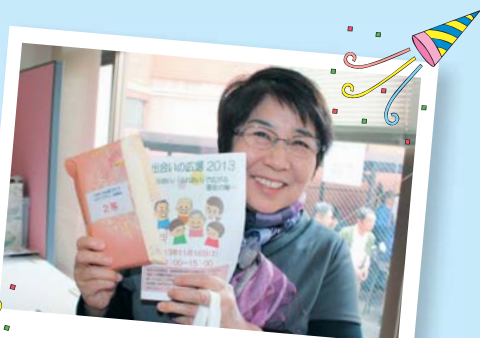
抽選 当たりました!!