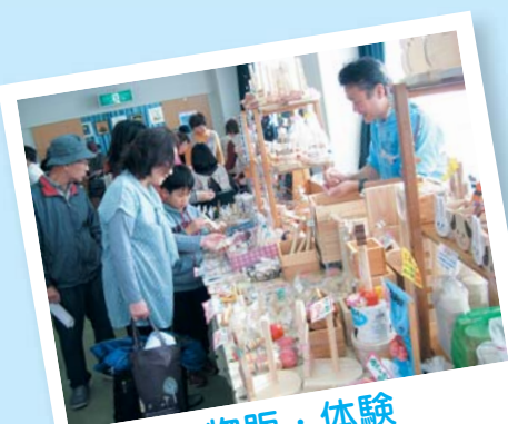
物販・体験 各ブース大盛況！

11月16日（土）総合福祉センターにて開催され、たくさんの方々に来場していただき、皆さんの交流となる良い機会となりました。ご来場いただいた皆さん、ありがとうございました！