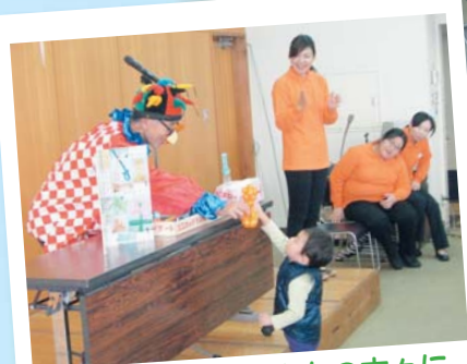
ステージもたくさんの方々に みていただき盛りあげました！